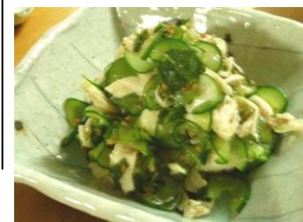
シソとキュウリと鶏むねの梅和え 夏の香りたっぷりです